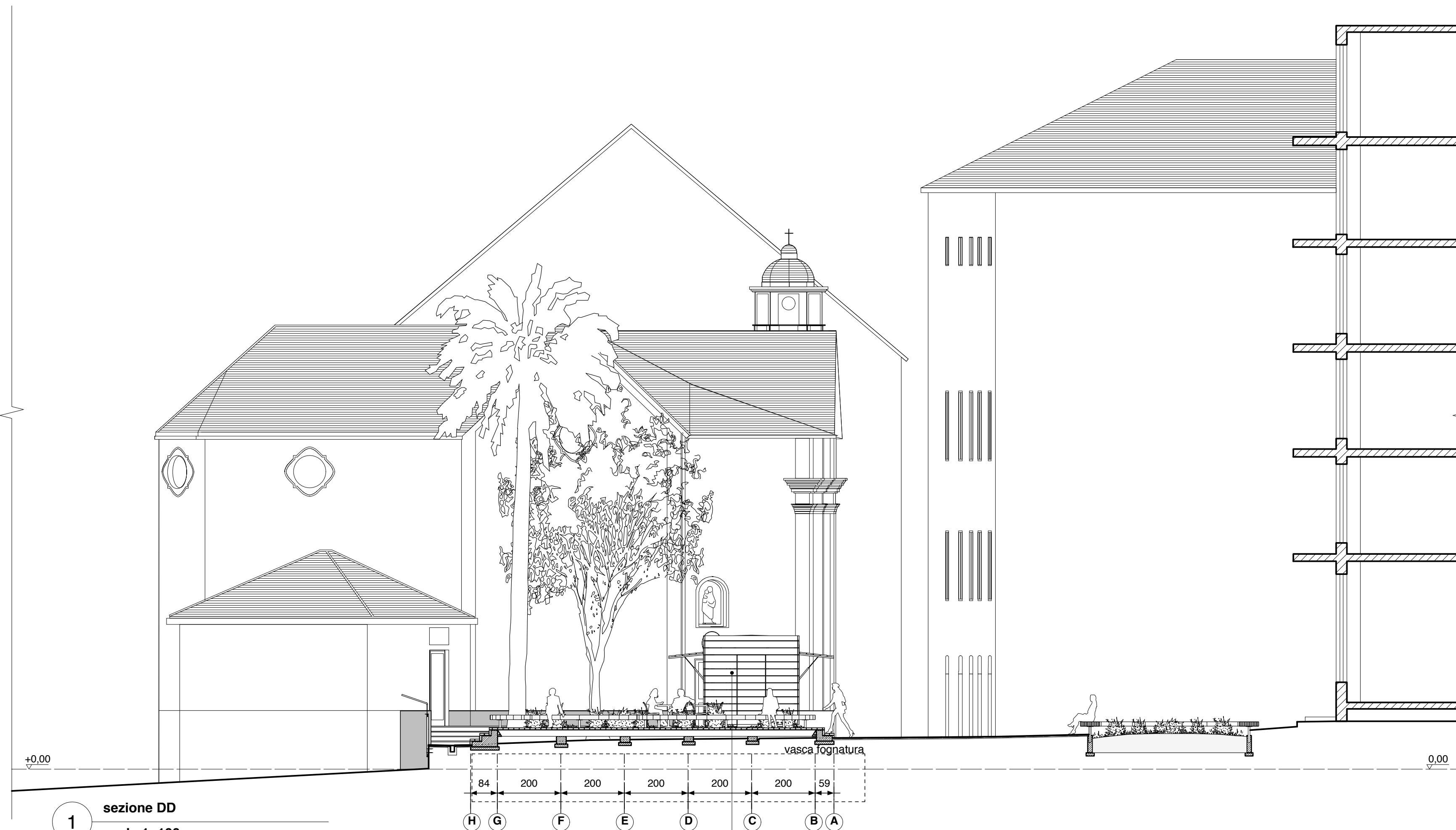
1 sezione DD scala 1: 100

N.B. il nuovo chiosco bar non è compreso nel precedente appalto