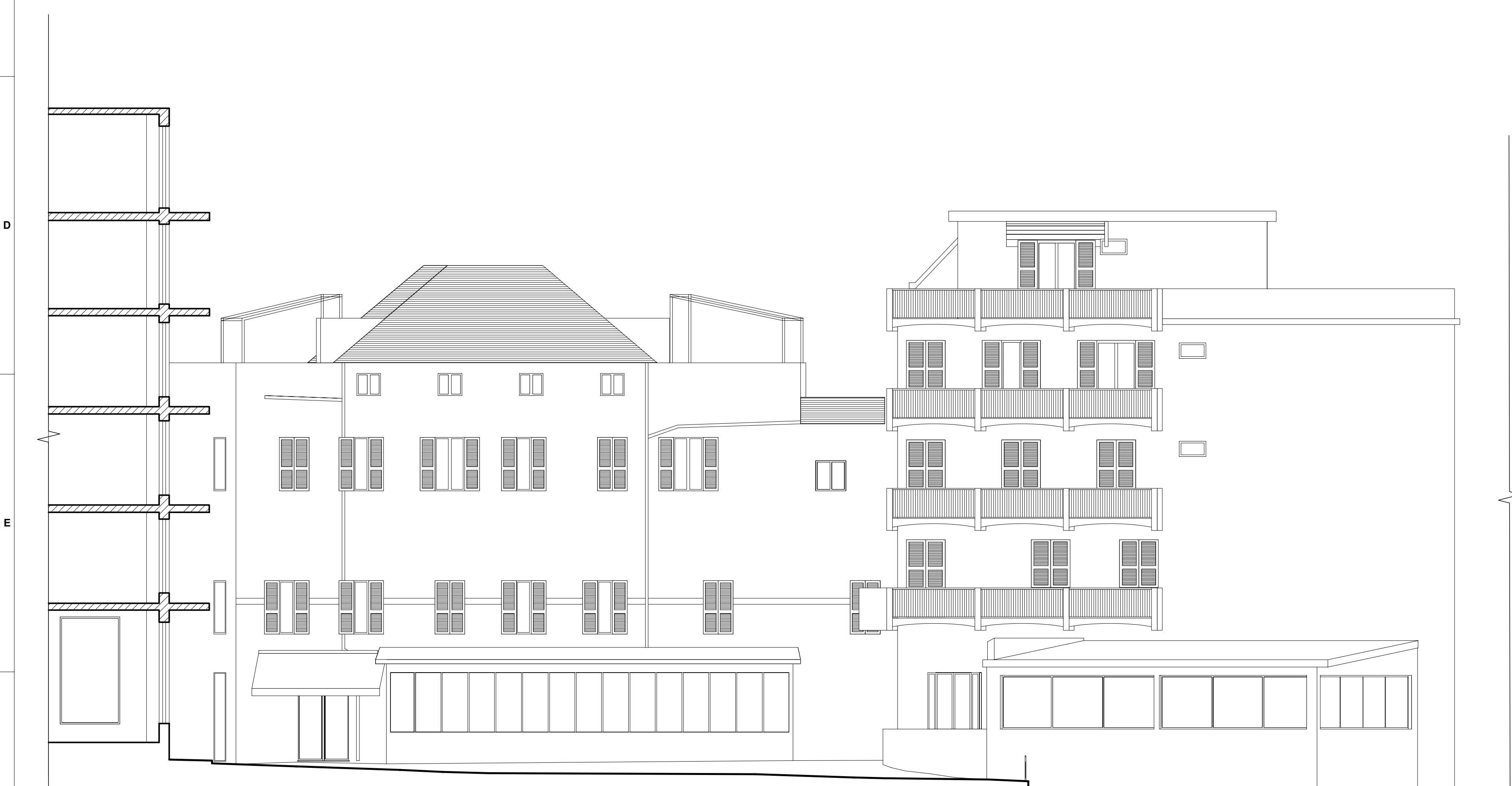
2 sezione CC scala 1: 100

N.B.: Tutte le misure vanno verificate in corso d'opera