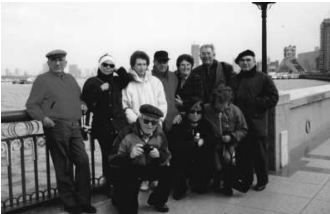
A Shanghai, sul lungo fiume Huang-Pu (1997)

Considerato il favorevole apprezzamento dei passati anni accademici da parte dei numerosi colleghi e allievi Unitre, continuiamo a dotare il libretto annuale dei programmi ed orari dei Corsi con varie citazioni (curate dal Direttore dei Corsi e tratte dal suo libro: "Figure sulla sabbia" 1986).